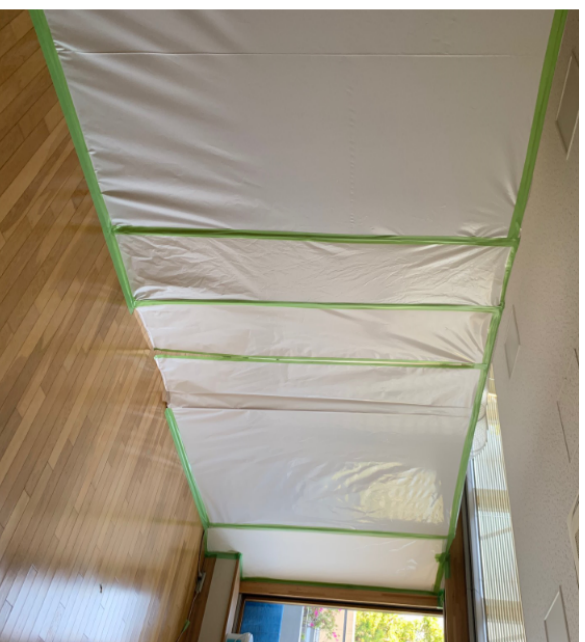
患者通過区域：患者入り口