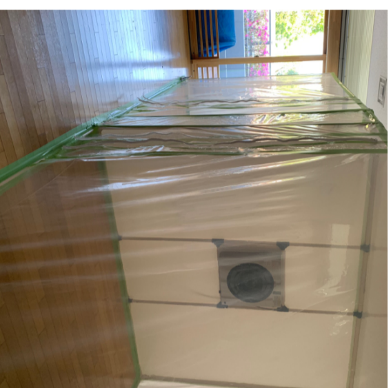
準汚染区域：スタッフ入り口